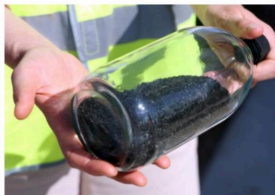
Fanny Greff présente un échantillon des charbons actifs choisis pour traiter l'eau à Hésingue.

Celle de Bartenheim, plus importante, l'a suivie et est arrivée sur place ce mercredi 23 juillet, par convoi exceptionnel. Il restera à équiper les captages de Saint-Louis. Les travaux ont commencé cette semaine également, mais ce sera un peu plus long et compliqué, précise Fanny Greff. Car