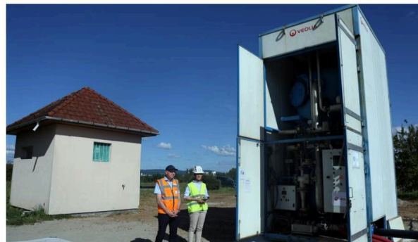
L'unité mobile de traitement de Hésingue est la première installée par Veolia, à côté du puits de captage, pour filtrer l'eau contaminée aux PFAS, grâce à des charbons actifs. Des installations similaires sont arrivées à Bartenheim. Suivra le site de Saint-Louis.

Ce qui change, c'est un by-pass entre le puits et le réservoir : dalle, raccords électriques et hydrauliques... « Nous avons fait un piquage qui va diriger l'eau, 100 % du débit pompé, vers un filtre à charbon actif en grains. » Un charbon bien particulier, soigneusement choisi et régulièrement remplacé (lire notre encadré) pour purifier l'eau et l'amener à être conforme aux normes qui seront en vigueur en janvier 2026 - à savoir 0,10 µg/l pour la liste des 20 PFAS retenus, une liste qui évoluera probablement à l'avenir.